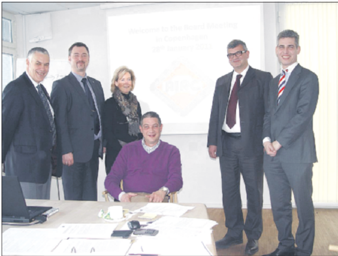
AIRC mødet foregik på 6. sal i Håndværkets Hus i København.

- AIRC Tips systemet med tekniske informationer på karrosseriområdet vil ligeledes danne grund-