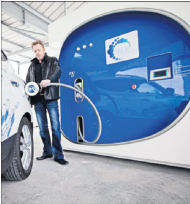
Air Liquide sætter fire nye brinttankstationer i drift i Danmark i slutningen af året.