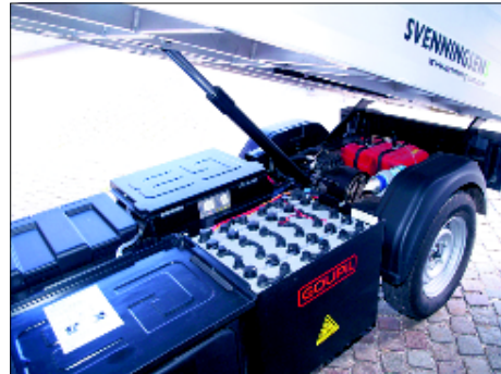
Der er lithium nok til milliarder af elbil-batterier, mener tysk forskningscenter.