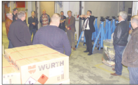
De fremmødte karrosserifolk blev vist rundt hos samarbejdspartneren Würth, der lagde lokaler og mad til SKAD-generalforsamlingen.