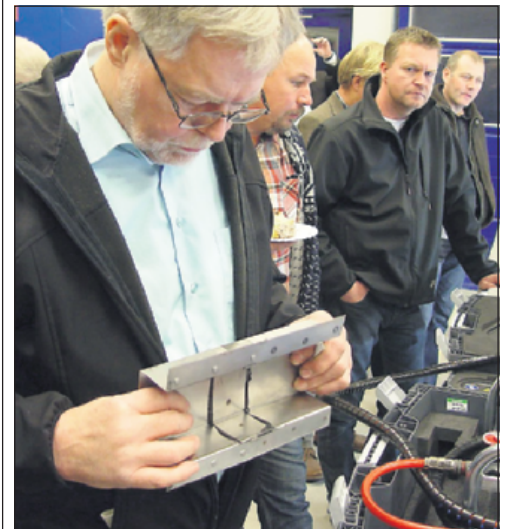
- Hmmm - et "svendestykke" i limning og nitning fra de tyske kurser bliver gået efter i sømmene af et SKAD-medlem.

På spørgsmål fra salen, om man ikke risikerer lettere at komme i konflikt i en stor gruppe, svarede direktøren, at SKADs bestyrelse ikke forventer optakt til konflikt med arbejdstagerorganisationerne de næste tre år på grund af den økonomiske og politiske udvikling. Men han medgav spørgeren, at SKAD tidligere er gået fri af en konflikt på grund af forskudt overenskomst, der fremover kommer til at følge de øvrige organisationers.