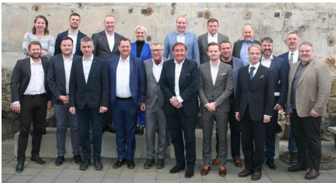
Repræsentanter for AIRC-medlemslande

At skabe nyt, udvikle og arbejde for høj kvalitet er nøgleord i vores virke. Som del af verdens største organisation indenfor vores arbejdsområder, AIRC International , samarbejder vi både i Europa, Skandinavien og over Atlanten. Mange af de "kugler" vi støber i Danmark, bygges på den store viden vores kollegaer besidder. Også på den politiske front har vi via organisationen direkte tilgang til EU, udenlandske myndigheder, tekniske instanser og politiske organisationer.